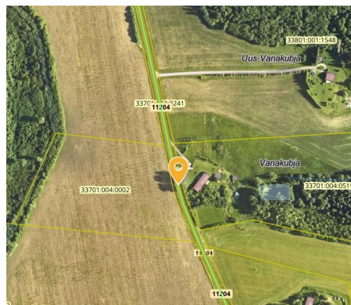
Joonis 2. Riigitee nr 11204 km 5,76

Transpordiamet ei võta endale kohustusi seoses uute bussipeatuste rajamisega, sh peatusetaskute, peenralaienduste, platvormide, istepinkide vms ehitamine. Vajadusel tuleb sellised tööd finantseerida kohalikul omavalitsusel.